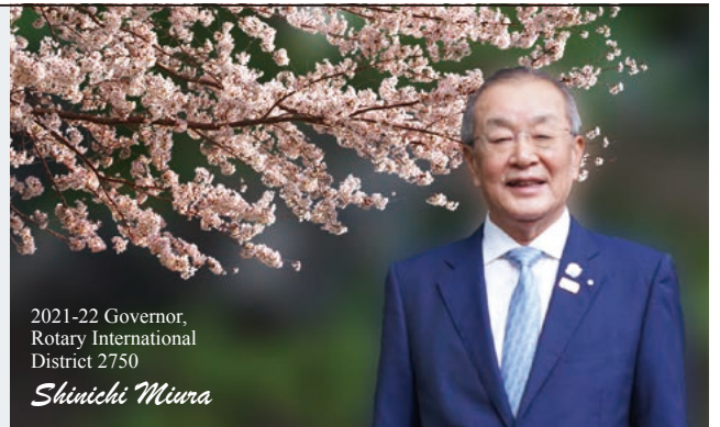
2021-22 Governor, Rotary International District 2750