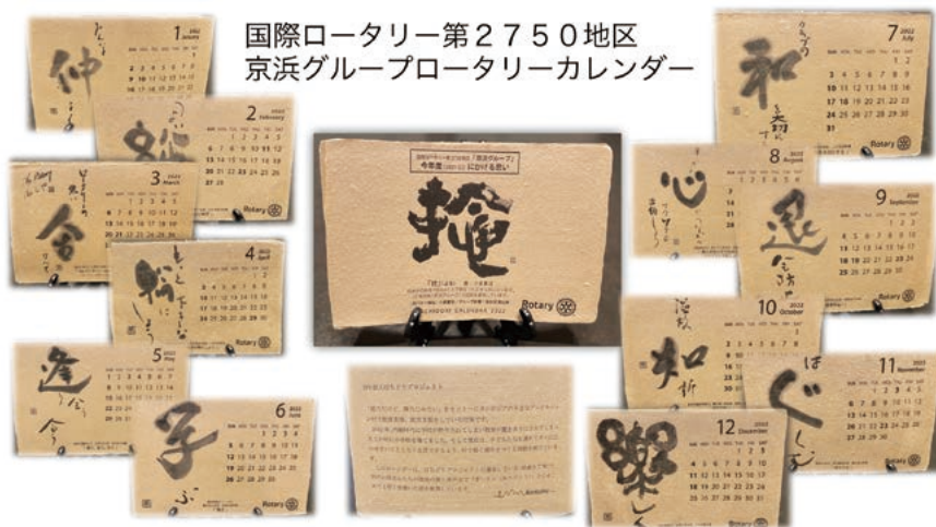
国際ロータリー第2750地区 京浜グループロータリーカレンダー