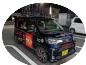
一緒に走り抜いたサポートカー