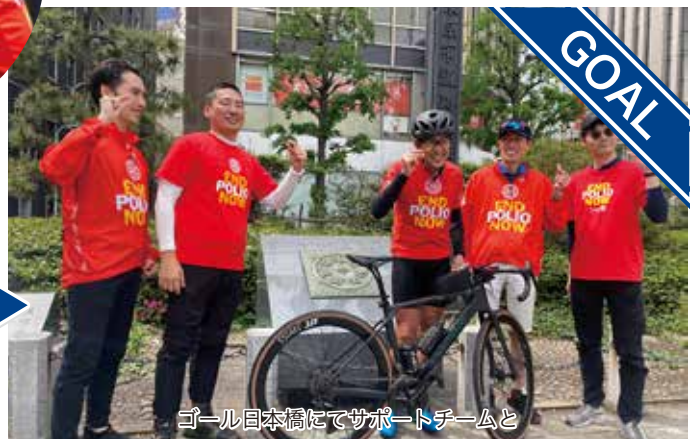
ゴール日本橋にてサポートチームと