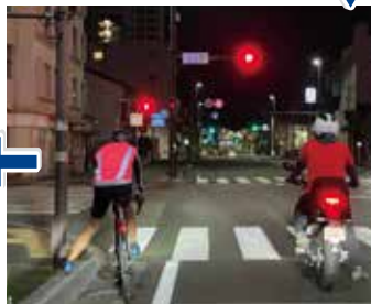
静岡通過は既に夜。