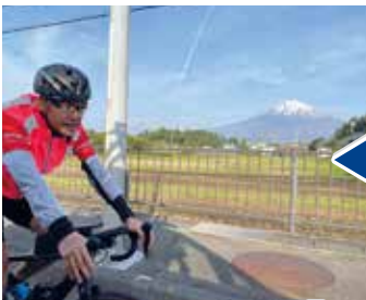
富士山も応援してくれてる？