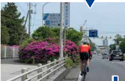
神奈川県横浜市に入り、ゴール日本橋まであと約 40km！