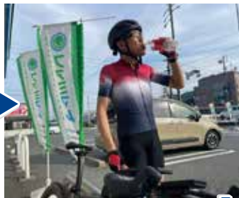
愛知県豊川市で小休止。またすぐに走ります！