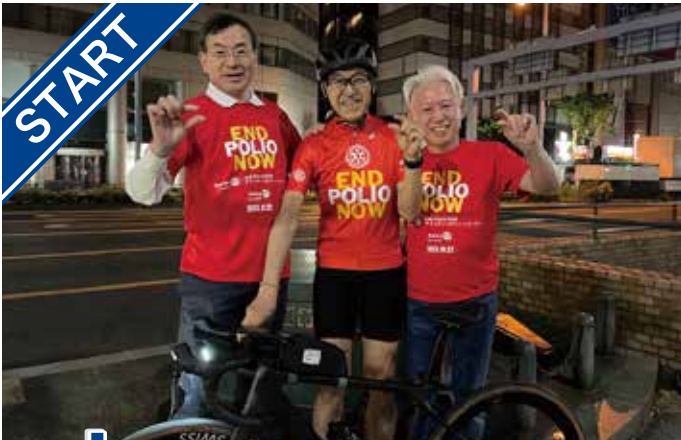
スタート地点「大阪市道路元標」にて