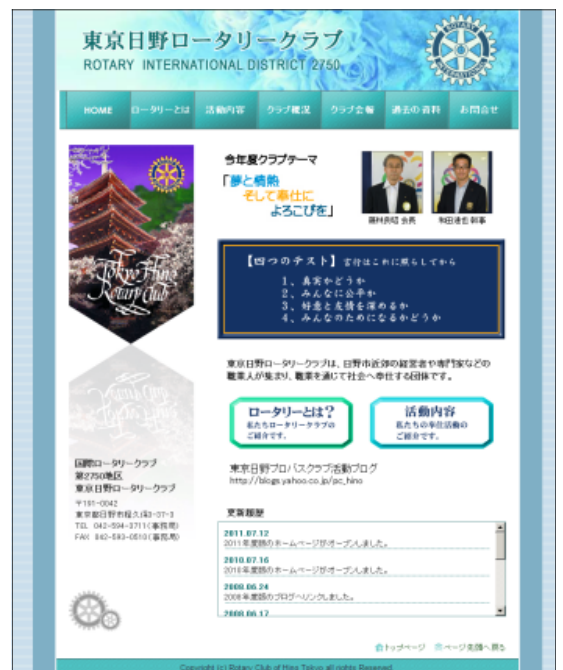
ホームページも年度更新しました