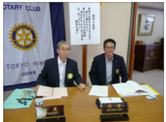
例会前の会長・幹事