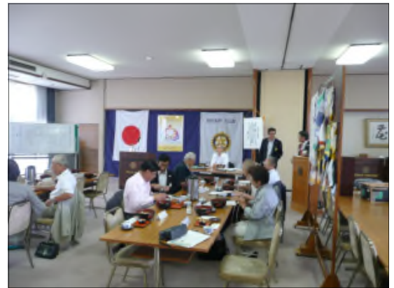
例会前のひととき