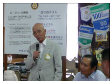
RCの魅力語る清水会員