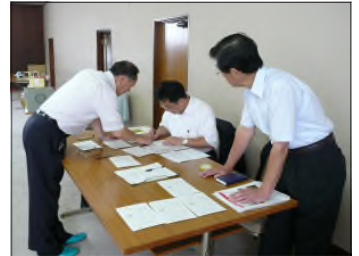
出席率計算方法の伝授