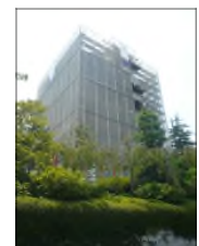
高幡不動尊(右は改修中の五重塔)