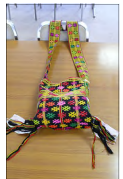
ミャンマーのバッグ