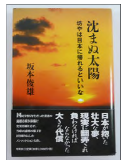
パスト・ガバナー 坂本俊雄氏著