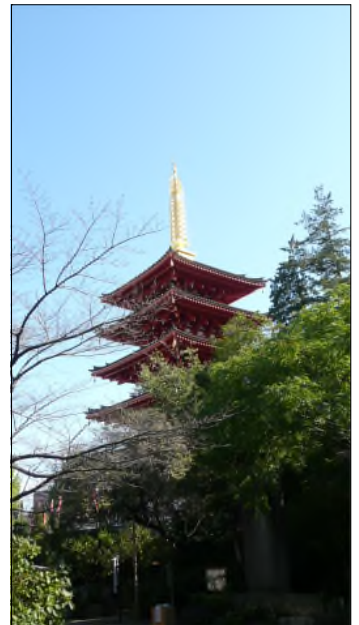
補修を終えた五重塔