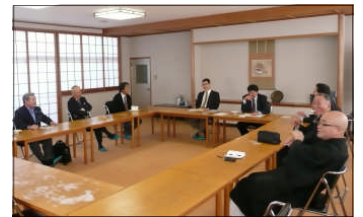
指名委員会 開催直前