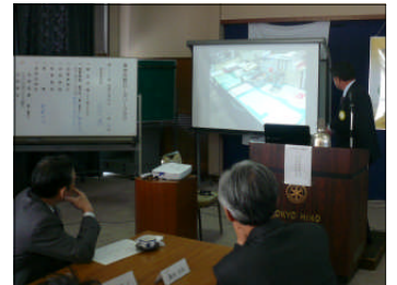
卓話(羽村市役所実例)