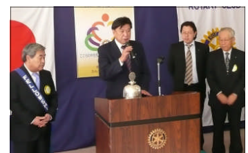
会長エレクトの挨拶