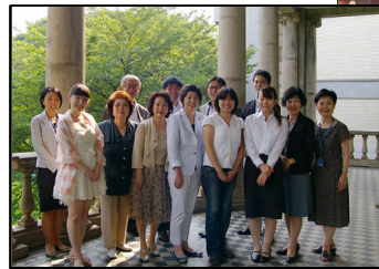
新クラブ設立準備