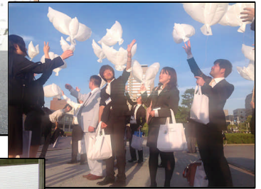
広島平和フォーラム参加