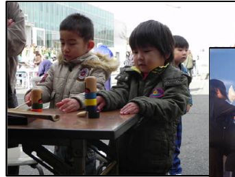
東北被災地支援活動