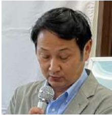
クラブ奉仕委員会