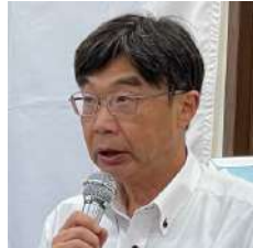
公共イメージ・会報委員会