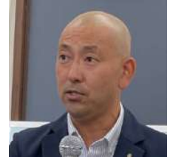
クラブ強化委員会