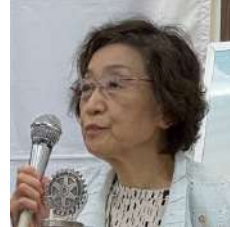
プログラム委員会