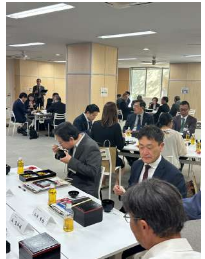
オープン例会の様子