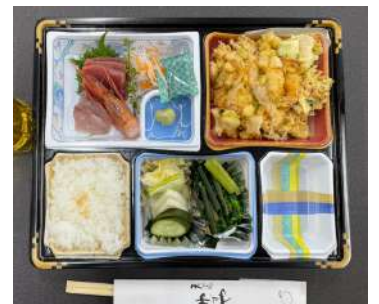
お弁当： 天ぷら ゆずや